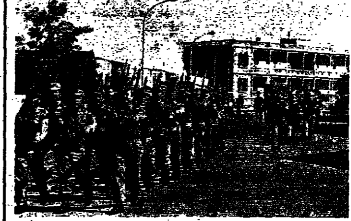
المعرض العسكري في ريات امس

زحله - من مراسل الانوار : اقيم في باحة نصب الجندي المجهول في تلة ريات امس ، عرض عسكري تقاسمه عيد الجيش . والتي تقام اوتبع كلمة في الاحتفال قال فيها : بالترغم من كل ما حصل ، لقد بقينا محافظين على تلة : وطننا وبقينا والقاعدة . وكذلك وحكم الوطنية التي ظهرت اليوم .